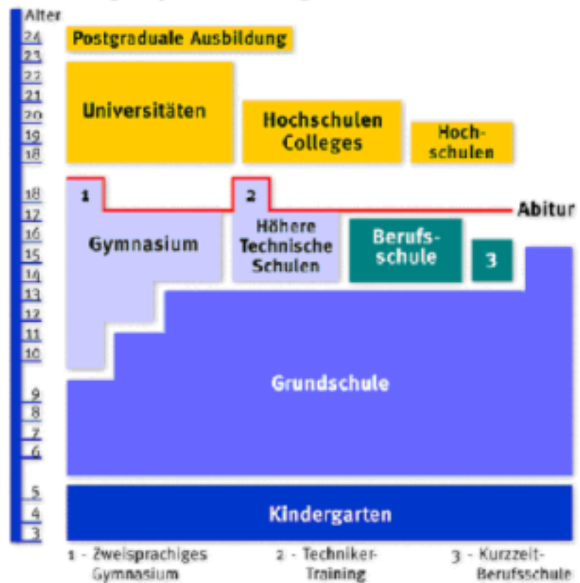
Abb. 1. Übersicht über das ungarische Bildungssystem